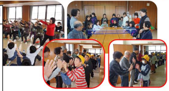
All Rights Reserved, Copyright (C) Welfare Committee 2018-11-28

正式な交流会としては、平成24(2012)年12月20日に、4年4組の児童32名より始まった。