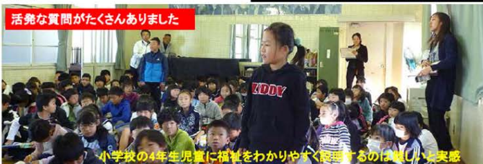
活発な質問がたくさんありました

正式な交流会としては、平成24(2012)年12月20日に、4年4組の児童32名より始まった。